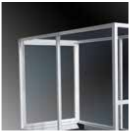
A richiesta: protezione Optional: protection guard